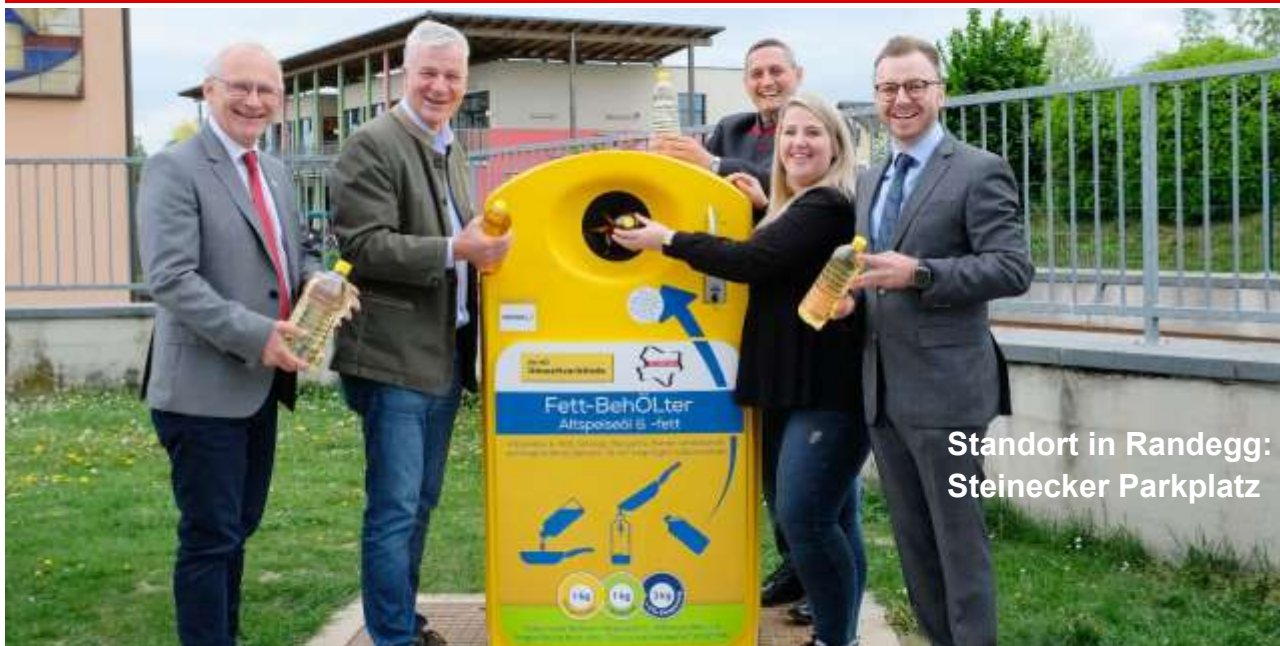
Standort in Randegg: Steinecker Parkplatz