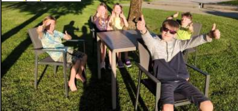
Die neuen Badmöbel wurden gleich mal ausprobiert