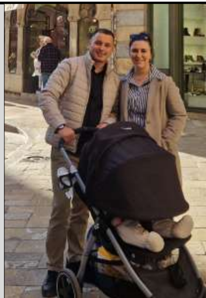
Die neuen Badbetreiber